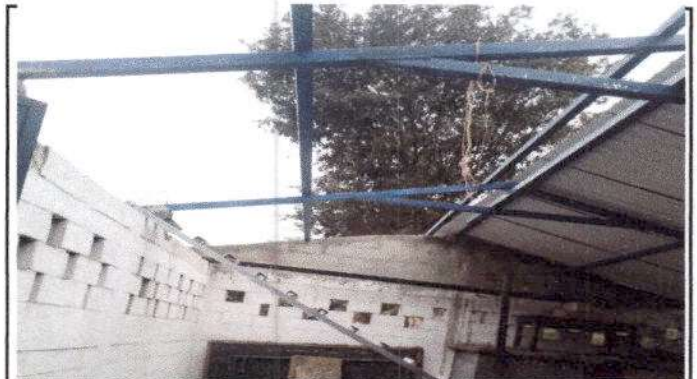
Foto 4: Estructura de Techo-Sustrucción lamina por lamina troquelada aluzinc calibre 26