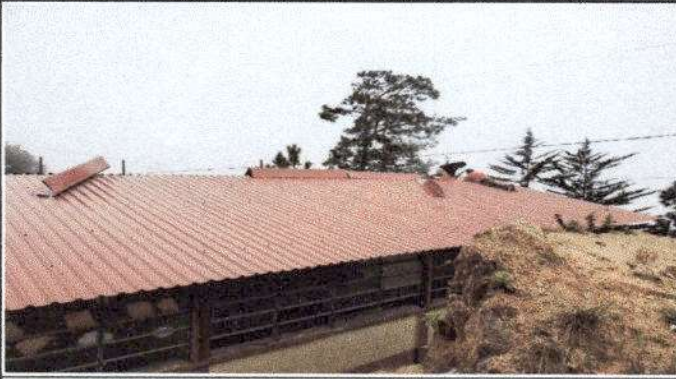
Foto 1: Sustrucción de Lamina, por lamina troquelada aluzinc calibre 26